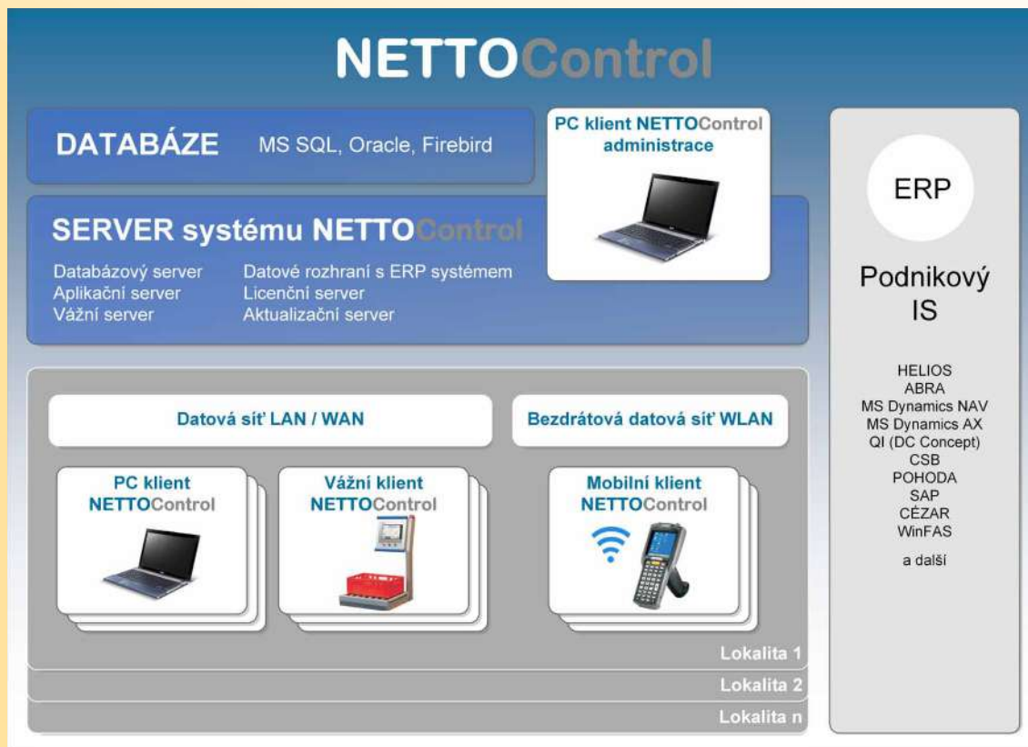
Schéma infrastruktury systému NETTOControl